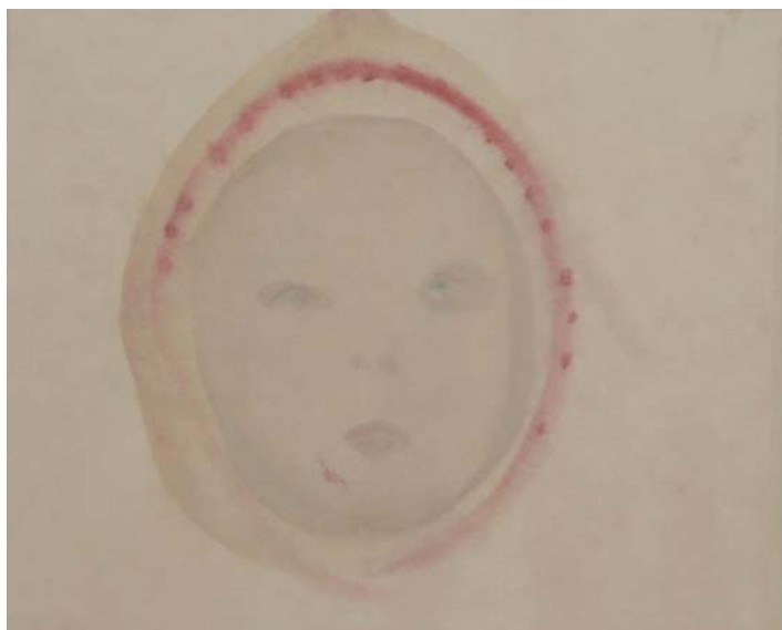
bloody drop, 27.3x22cm, japanese paper, water color, wood printing, 2011

Akiruno City, Tokyo Machida City Museum of Graphic Art Tosa Washi International Committee