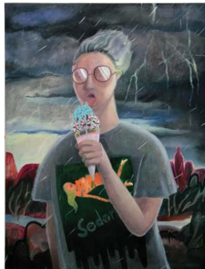
フラッシュ / Flash, 118x90cm, oil on canvas, 2010

2006 "INDEX#2 LIFE STYLES" (ARTZONE / Kyoto) / (Tokyo Wonder Site / Tokyo) 2007 "WORM HOLE episode MIHOKANNO" (magical, ARTROOM / Tokyo) 2008 "MONT BLANC Young Artist Patronage in Japan" (the home office of MONT BLANC / Tokyo) "Vrishaba through Mithuna" (hiromiyoshii / Tokyo) 2009 "Team 15 MIHOKANNO -HELLO! MIHOKANNO" (Tokyo Wonder Site / Tokyo) "IMAGINARY MUSEUM OF THE O-COLLECTION" (Tokyo Wonder Site / Tokyo) 2010 "Power of a Painting" (island / Chiba) "Waku Waku JOBAN-KASHIWA PROJECT" (TSCA / Chiba)