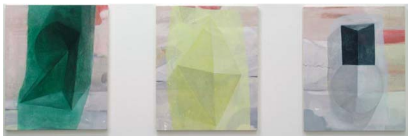
さよなら、白昼夢 i / ii / iii / Good-bye daydream- i / ii / iii, 63.5x53cm each, oil on canvas, 2010