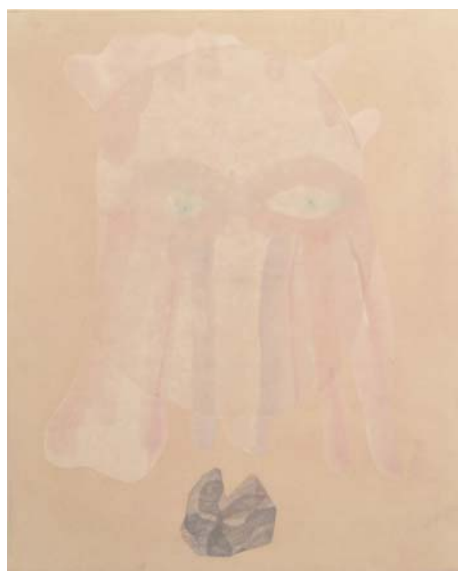
hematitle, 65.2x53cm, japanese paper, water color, wood printing, 2010