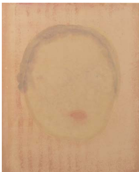
stripe streigh, 65.2x53cm, japanese paper, water color, wood printing, 2011