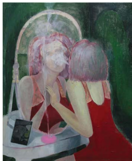
ピンク・アシュトレイ / Pink Ashtray, 92x76cm, oil on canvas, 2010