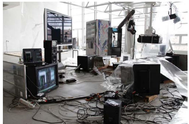
土居下太意 / Tai Doishita Pouringmouse Ver.0.1 resizable, mixed media, 2008