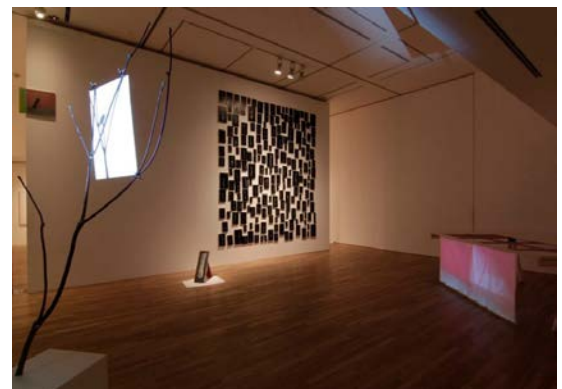
野沢裕 / Yutaka Nozawa Still Life with Landscape installation view, 2011

JEANS FACTORY ART AWARD 2008, Second prize