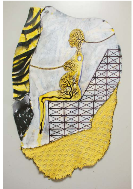
有賀慎吾 / Shingo Aruga cut and suture(Fragments of the Yellow Swamp) 67x42cm, mixed media, 2011

2009 "Dream of Cyborg"(Art Trace Gallery / Tokyo) "SETSUZOKU KAIJO"(Art Center Ongoing / Tokyo) "IKI -threshold-" (Sustainable Art Project,Ueno Town art Museum / Tokyo) "Sticky Sloppy Lumpy"(TURNER GALLERY / Tokyo) 2010 "5th Dimension" (Art Center Ongoing, NO MAN'S LAND, French Embassy / Tokyo) "Neo New Wave"(island / Chiba) "House"keep out"(Art Center Ongoing, KOGANECHO BAZAAR / Kanagawa) "Transformation in Large Plaster Cast Gallery" (Tokyo University of the Arts / Tokyo) 2011 "Power of a Painting"(3331 Arts Chiyoda / Tokyo) "Story of the Island"(Shodoshima island / Kagawa) "GOD HAND"(Art Line Kashiwa / Chiba) "TERATOTERA"(PARCO Kichijoji / Tokyo) "SLASH/05 -Syntactile-"(SPIRAL GARDEN / Tokyo) "The tale of the new famous place in Sumida River"(Tokyo) "THE COLOR OF FUTURE-The look to draw in-"(TURNER GALLERY / Tokyo) 2012 "BERMUDA TRIANGLE"(Château 2F / Tokyo)