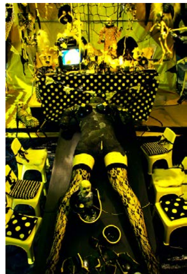
有賀慎吾 / Shingo Aruga Fragments of the Yellow Swamp mixed media, 2011