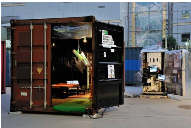
土居下太意 / Tai Doishita Pouringmouse KabukichoVer. mixed media, 2011