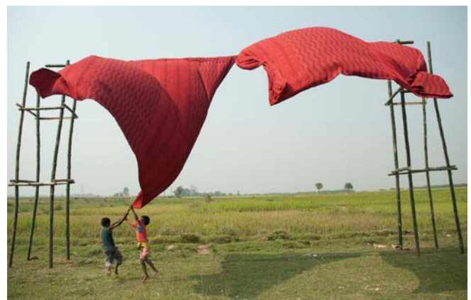
野沢裕 / Yutaka Nozawa Opening the Curtain installation view, 2011