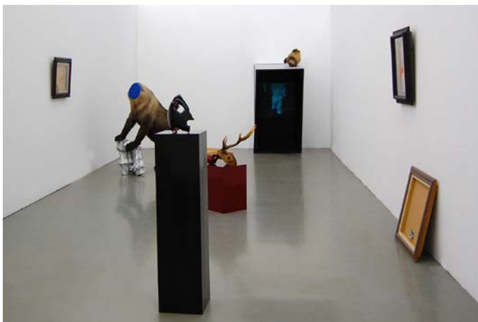
青木真莉子 / Mariko Aoki マザースペース resizable, mixed media, 2012