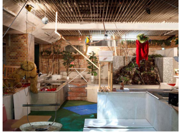
《サントワマミー》 2011年 オウム、金魚、水、ミラーボール、不要となったもの、DVD(シャンソン歌手に扮してこの場所で歌っている映像。子供の頃に行った、この場所の池と似たものが残った潰れたホテルの映像)