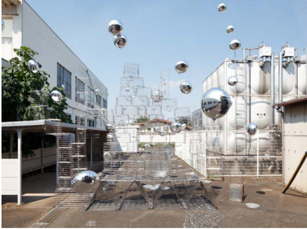
《水位》 2011年 不要になったもの(給食調理器具)、ステンレス、アルミ素材、ヘリウムガス、他