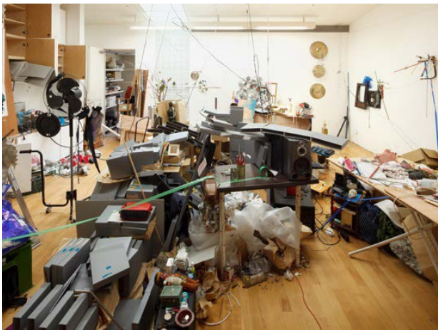
《返る見る彼は、川を渡り、仕事へ向かう》 2010年 - 2011年 府中市美術館 公開制作