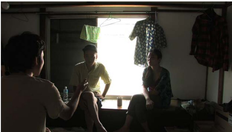
「Ms.S」 42min, video, 2011