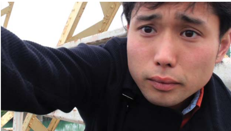
「Mr.S&ドラえもん」 14min, video, 2011