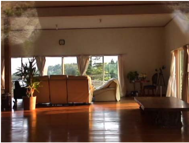
「GOD AND FATHER AND ME」 36min, video, 2008