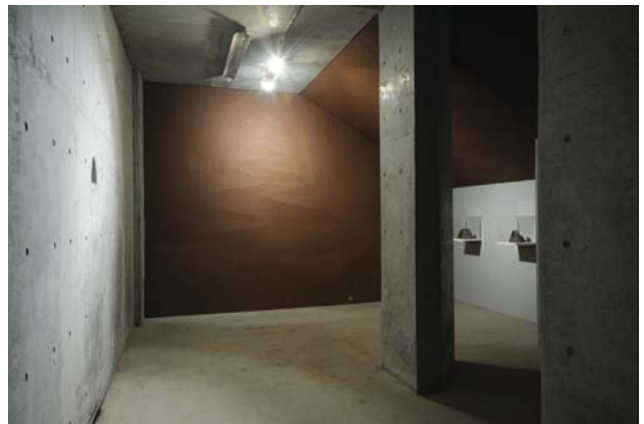
蜂の洞窟 / たちのやま, resizable, industrial clay, oil clay, etc, 2009