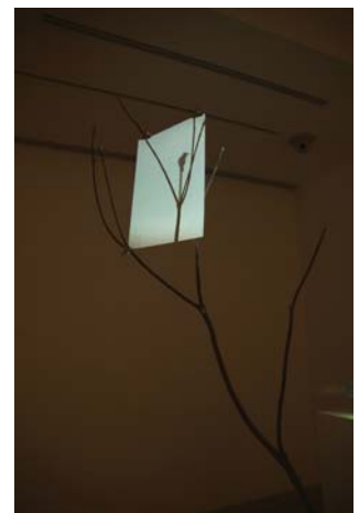
鳥, installation view, 2011