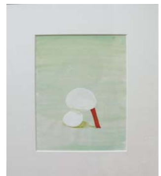
支える, watercolor on paper, 2012