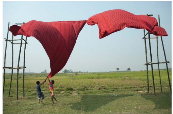
Opening the Curtain, installation view, 2011

2008 JEANS FACTORY ART AWARD 2008, Second prize