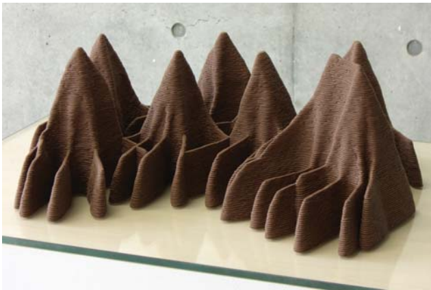
無題, H17×W60×D45cm, industrial clay, glass, 2008

2009 “ANOTHER FUNCTION”FUDEYA Corporation(Tokyo) 2010 “From every place the distance apart”(Artisut's studio / Kanagawa)