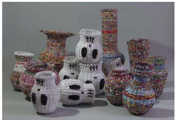
広告編み罫文籠, resizable, flyer, 2011