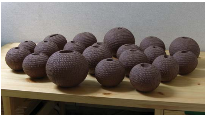
無題, resizable, industrial clay, stone, 2010